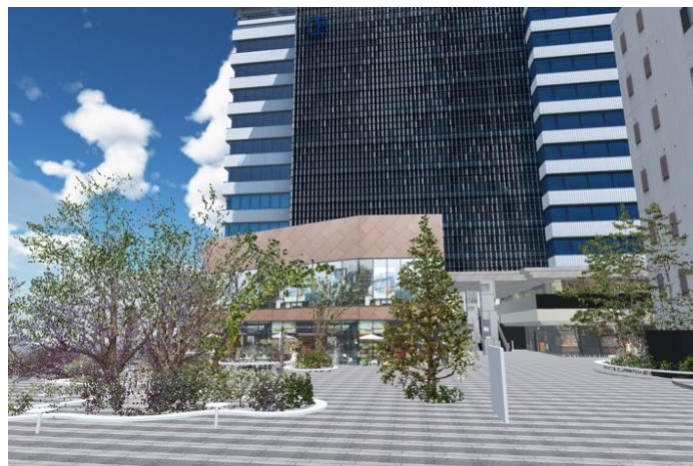
バーチャル空間上に再現された渋谷キャスト

今後も、都市や施設などの3D空間データを活用した新たな体験サービスの可用性研究に取り組んでまいります。