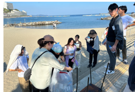
イノベーショントリップ：静岡県・熱海でのビーチクリーン体験

グループ横断で、若手社員がつながり、ともに深い体験の時間を重ねることで、チームとしてのチカラを生み出す、創発への端緒となっています。